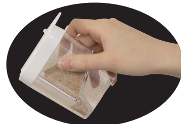
だし入りイメージ