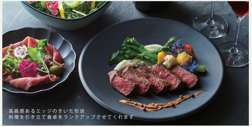
高級感あるエッジのきいた形状 料理を引き立て食卓をランクアップさせてくれます