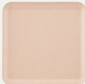
オーガニックベージュMT (OBEM)