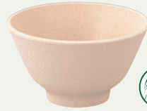
オーガニックベージュMT (OBEM)