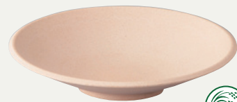
オーガニックベージュMT (OBEM)