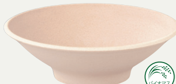
オーガニックベージュMT (OBEM)